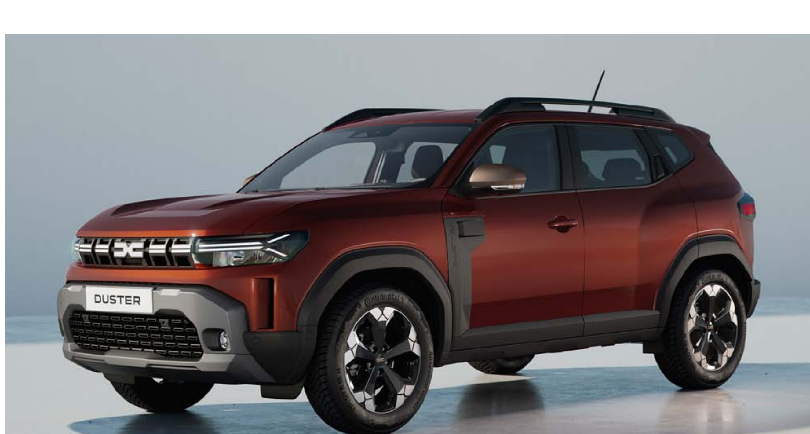
BRUN TERRACOTTA (1)