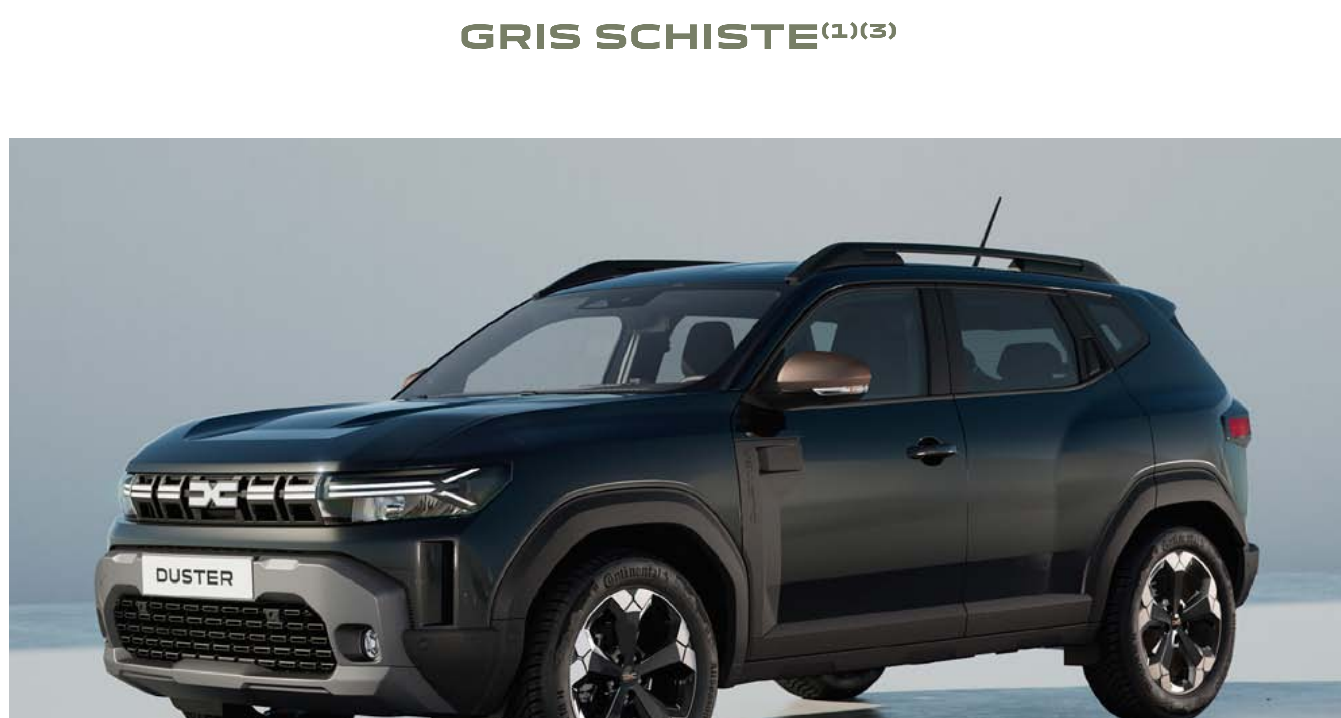
NOIR NACRÉ (1)