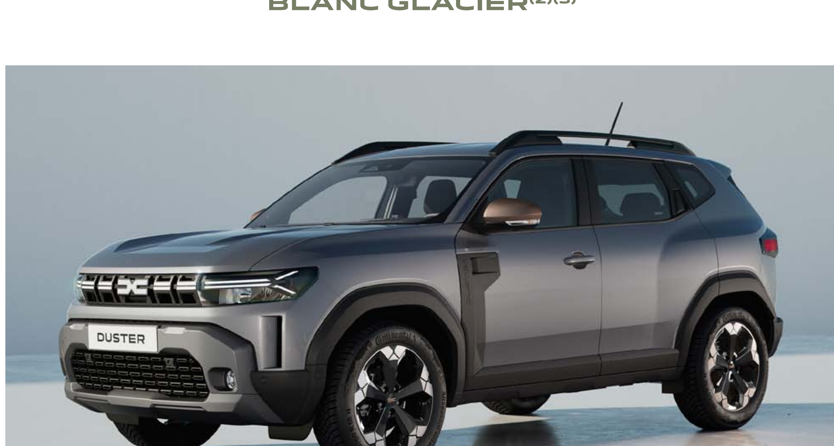
GRIS SCHISTE (1)(3)