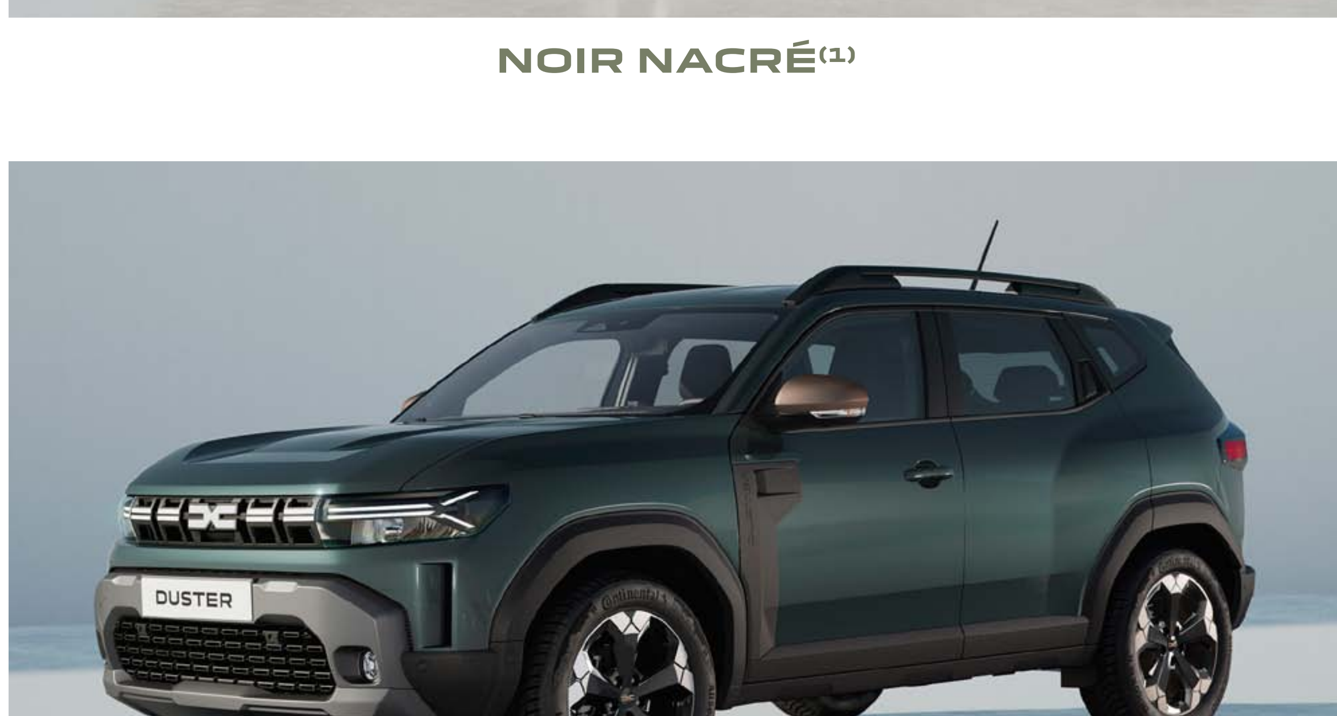
CEDAR GREEN (1)