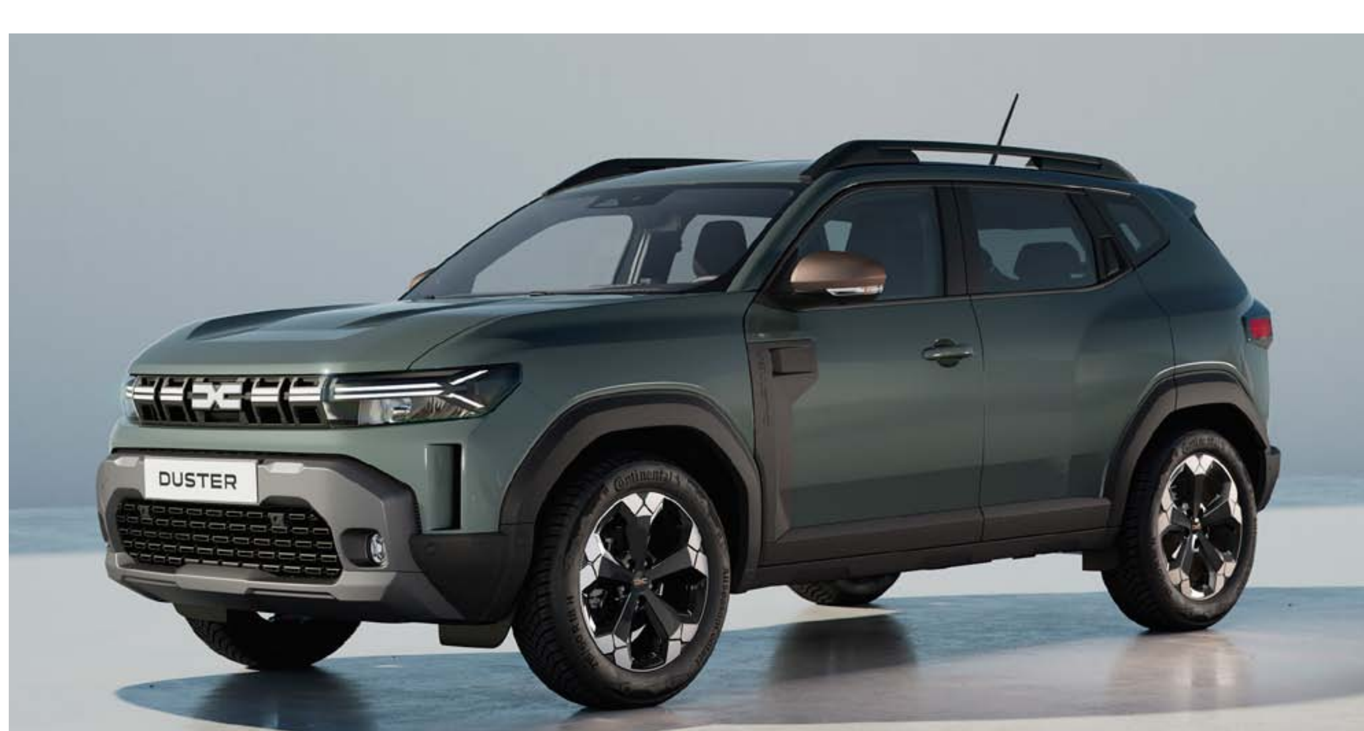
LICHEN KAKI (2)(3)