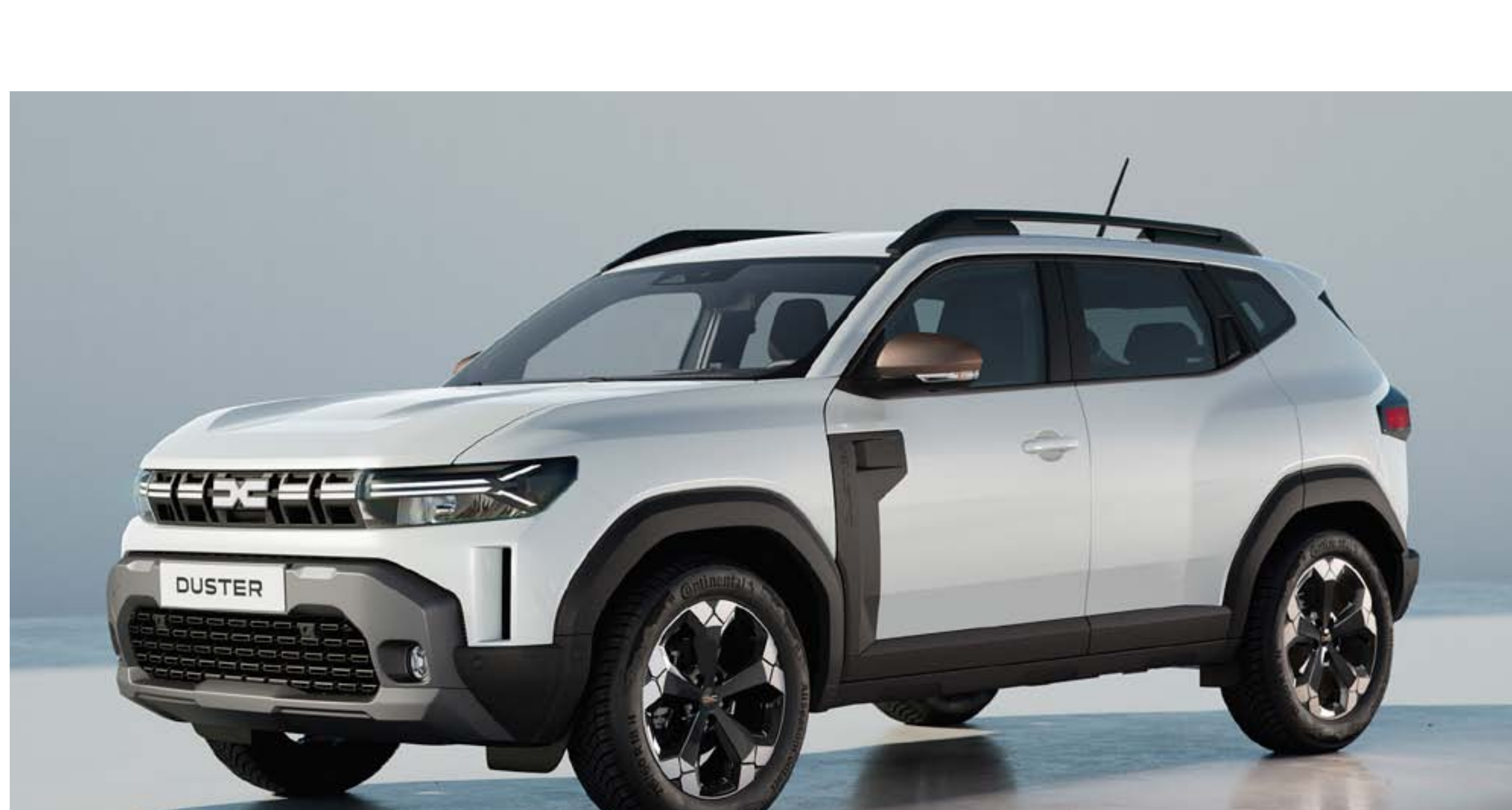
BLANC GLACIER (2)(3)