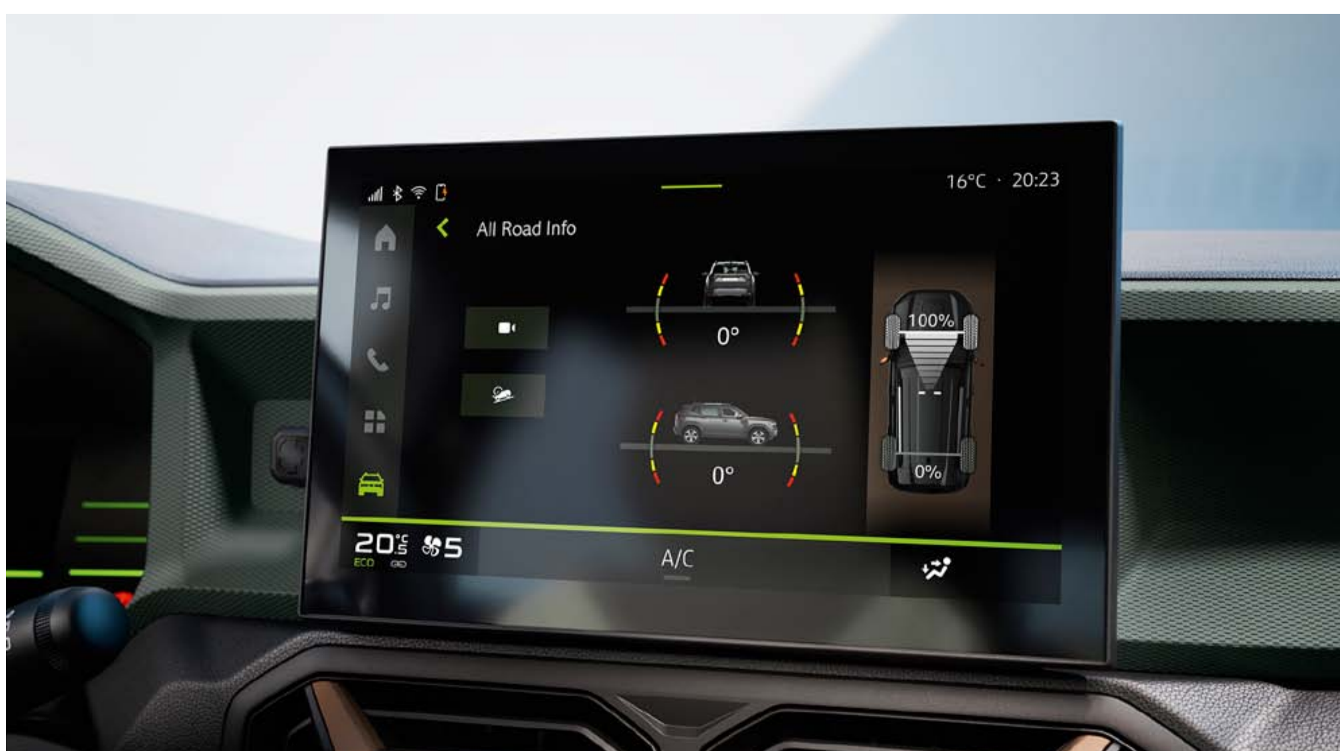
Touchscreen met hoogtemeter

Verhoogde bodemvrijheid tot 217 mm, een hellingshoek van de bumper tot 31° voor het beklimmen van steile hellingen in de 4x4-modus, Starkle ® -antikrasmaterialen: de nieuwe Duster is trouw aan zijn SUV-DNA en kan elk terrein aan.